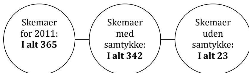
Figur 1. Oversigtsfigur for skemaer i 2011

Som nævnt ovenfor har 342 brugere givet samtykke til at deltage i Årsstatistikken 2011, mens 23 ikke har givet samtykke. 12 De indgår derfor ikke i resten af statistikken.